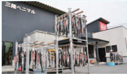
三陸ベニマル 〒028-1102 大槌町赤浜一丁目226 TEL 0193-27-8980