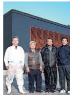
ど真ん中・おおつち協同組合の皆さん

三陸海岸のほぼ真ん中に位置する大槌で立ち上がった「ど真ん中・おおつち協同組合」。海の魅力と感謝の気持ちを伝えるため、今後もチャレンジが続きます。