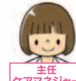
主任 ケアマネジャー