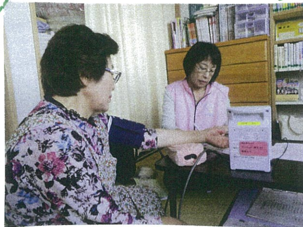
( 血压の正しい測り方 )