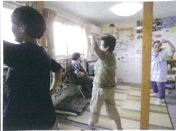
自由に手足が伸ばせる様になりました。