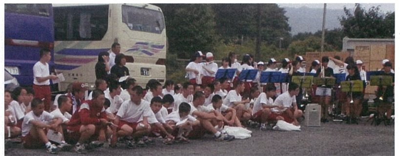
8月11日 秋田県太田中学校 うちの配布