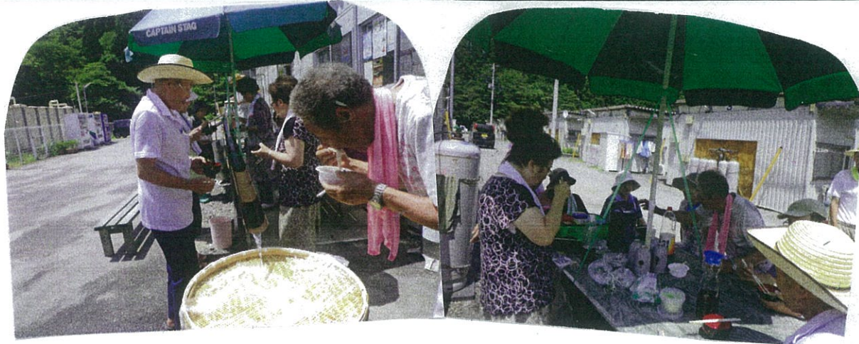
8月6日に行われた清涼交流会での流しそうめんも 大成功 でした 笹