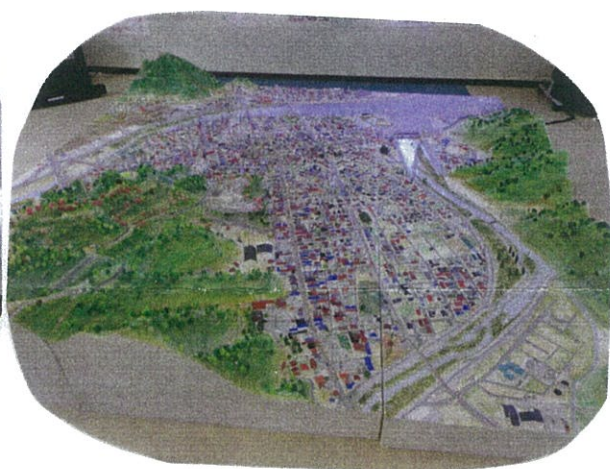
8月20日 生涯学習課さん主催の 「大植読書ミニ祭」が行われました。 神戸の学生さんが製作した大植町の 街並の模型が展示されました。 「吉里吉里と浪板の模型もほしかったね」 という声もありましたね 台

暑、夏も終わり。 最近では肌寒くなって きましたね。雨も多かったけど とても暑かった夏……。 子供達の海やプールで日 焼けしてる姿がたくさん 見かけられました 咲 気温が上がったり下がっ たりと体調管理に 気をつけたい 時期です。 残暑にも 注意しましょう。