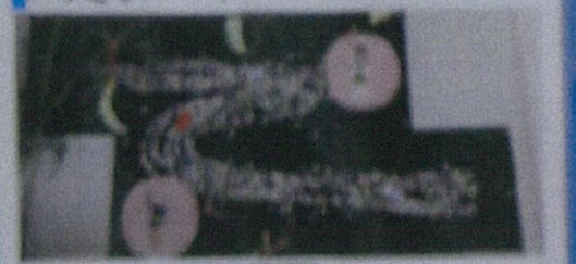
3/10 カリタス、たに焼きイロン