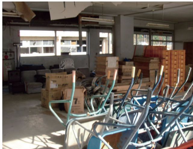
②作業に必要な資材を管理