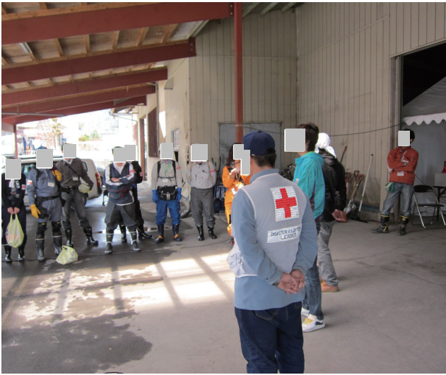
マッチング（コーディネート）