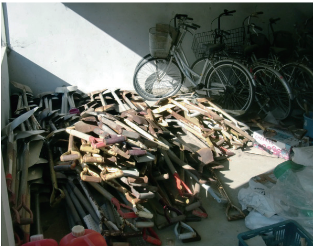
①作業に必要な資材を管理