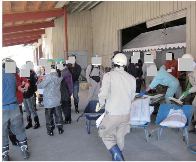
作業に使う道具の準備