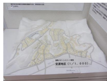
復興パターンイメージ模型