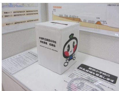
合併新設小学校名応募箱