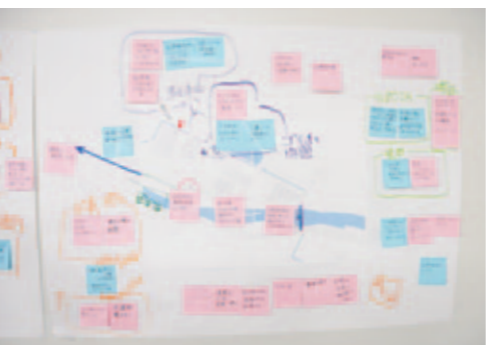
話した事柄は全て書き出してマップに並べていく

取り組みの一つに、住環境点検ワークショップがあります。これは、自分たちの住む仮設団地を自ら点検し、改善に向けて意見を出し合う会です。これまでいくつか