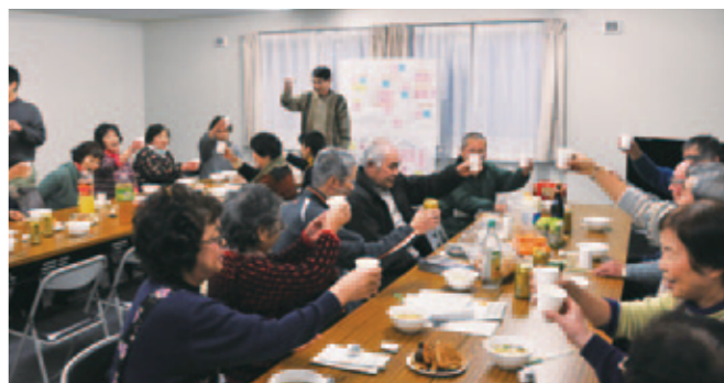
活動の後、みんなで食べ物を持ち寄っての交流会