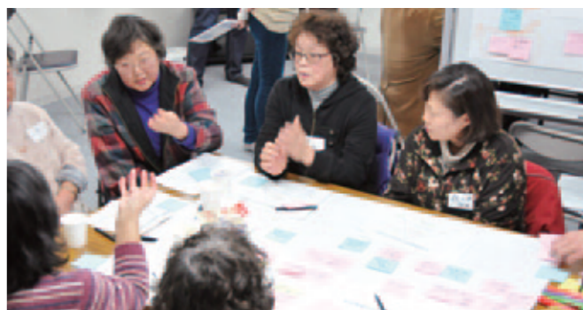
女性たちのグループからは家事などに関わる細やかな意見が