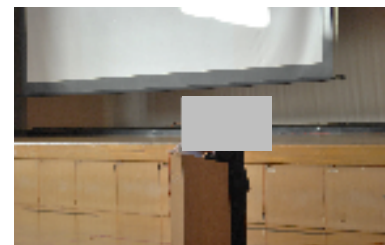
【復興計画を発表する地域代表者】