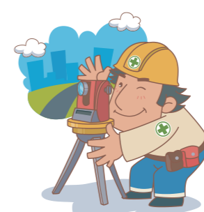
・現地での測量実施 ・仮杭設置