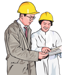
・現地での立会いの下、境界（地区界）を確認 ・区画整理区域を決定