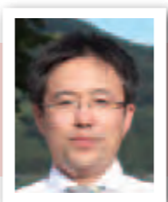
にのみや こうよう 二宮 康洋 教育次長 兼 教育部長 (岩手県)